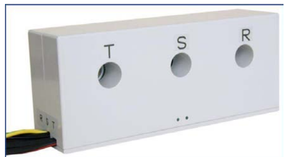
Extendedor de corriente 240 / 5 A CE 1324B