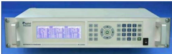
Patrón de referencia 2x30 (vista del frente)