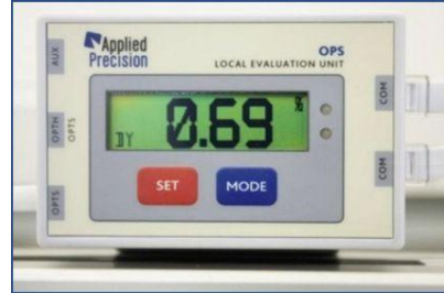
Unidad local de evaluación OPS