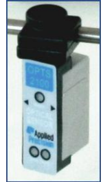
Sensor óptico OPTS 2100